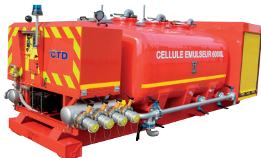
Salamandre 240 auf Abrollbehälter Schaum