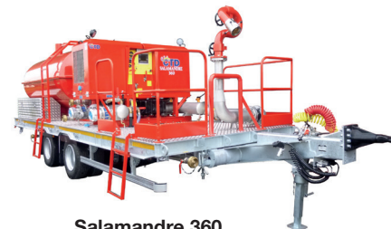
Salamandre 360 auf Anhänger