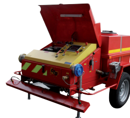
Salamandre 120 auf Anhänger