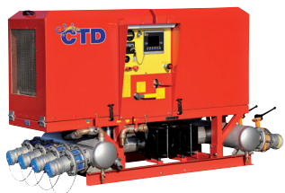
Salamandre 360 Frei tragende Einheit